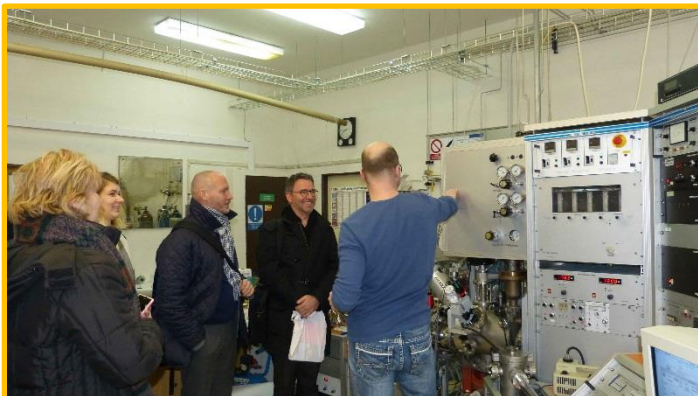
Prohlídka laboratoří UJEP v únoru 2018.

Nanotechnologie a moderní materiály byly tématem druhé tzv. TRANS 3 Net.visit začátkem února 2018 v Ústí nad Labem. Celkem 28 účastníků z vědecké sféry a z malých a středních podniků navštívilo prostory Přírodovědecké fakulty, Fakulty strojního inženýrství a Fakulty životního prostředí Univerzity J. E. Purkyně v Ústí nad Labem. Okružní prohlídka různých laboratoří přinesla vědcům, podporovatelům transferu a zaměstnancům malých a středních podniků zajímavý pohled na současnou situaci výzkumu na UJEP. Účastníci ocenili zejména rozmanitost a možnost výměny zkušeností s