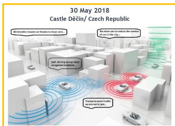
Simulace autonomní dopravy, která bude tématem veletrhu v květnu 2018.

SMART MOBILITA - hudba budoucnosti: čistá, sdílená, inteligentní, mobilní a samoříditelná. Toto je téma našeho prvního veletrhu TRANS 3 Net. Veletrh je pojat jako výstava aplikovatelných výsledků výzkumu, která je základním krokem pro potenciální spolupráci. Srdečně tak zveme výzkumné instituce, univerzity a technologické agentury, aby zde prezentovaly své záměry, projekty a využitelné výsledky výzkumu v oblasti inteligentní mobility. Bylo by dobré představit něco, co je hmatatelné a srozumitelné pro návštěvníky. Na druhé straně zveme vědce, zaměstnance malých a středních podniků a obcí ze Saska (Německo), Dolního Slezska (Polsko) a Ústeckého kraje (Česká republika), které se zabývají inteligentní mobilitou. Pozvánka je k dispozici zde .